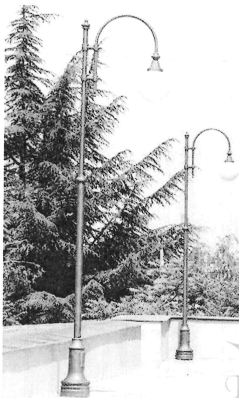
Rekomendacinio vaizdo šviestuvas su stovu